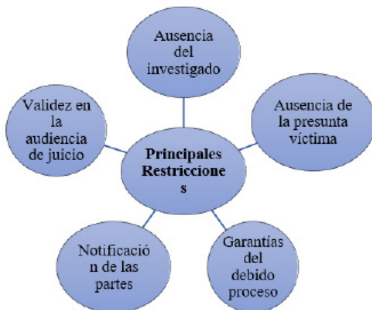
Figura 1. Restricciones procesales del testimonio anticipado.

La prueba es pieza clave dentro del desarrollo del proceso penal y, por ende, de las garantías del debido proceso, por lo que, al negarse la práctica de prueba en el momento procesal idóneo, se estaría negando el derecho de las partes a un juicio en igualdad de condiciones. La diligencia del testimonio anticipado abona los principales quiebres al sistema acusatorio al quitarle su corte adversarial, al carecer de inmediación y contradicción, conforme se expuso en líneas anteriores. Las restricciones procesales que se aprecia en los argumentos teóricos constantes en la práctica de este testimonio en lo siguiente (Figura 1):