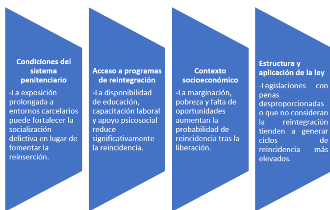
Figura 1. Factores que inciden en la reincidencia juvenil.

Sin embargo, la efectividad de estas políticas y leyes en la prevención de la reincidencia es objeto de debate y análisis (Chiluiza Naranjo, 2024). Ecuador se enfrenta a un contexto complejo en términos de delincuencia juvenil, influenciado por factores socioeconómicos, culturales y estructurales (De la Rosa Rodríguez, 2022). La falta de oportunidades educativas y laborales, la pobreza, la violencia intrafamiliar y el acceso limitado a servicios sociales son solo algunos de los factores que contribuyen al ciclo de la delincuencia juvenil y la reincidencia (Figura 1).